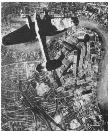
Германский бомбардировщик Heinkel He 111 над доками Лондона, 1940 г.

Летом 1940 г. СССР, используя свои войска и сочувствие части населения, установил просоветские режимы в государствах Прибалтики и присоединил Эстонию, Латвию и Литву в качестве новых советских республик. В августе 1940 г. был заключён договор с Румынией, и СССР вернулись Бессарабия (создана Молдавская ССР) и Северная Буковина (присоединена к Украинской ССР).