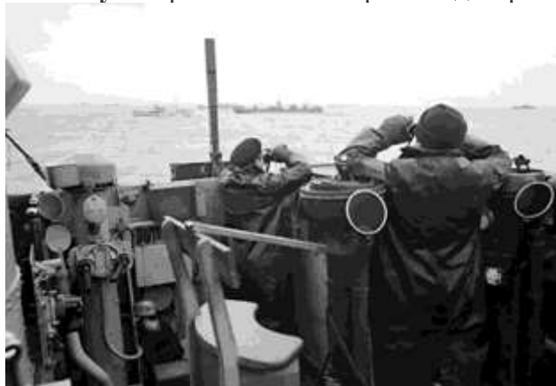
Офицеры на мостике британского эсминца ведут наблюдение.

В апреле и мае 1941 г. немецкие и итальянские войска оккупировали Югославию и Грецию. В Северной Африке развернулись бои с англичанами. В Атлантическом океане с 1939 г. шла Битва за Атлантику — сражения за контроль над морскими коммуникациями.