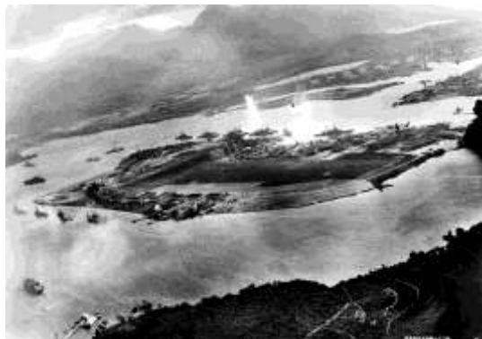
Линкор Роу. Снимок сделан с японского самолёта в начале атаки на Пёрл-Харбор.

Япония действительно готовилась к удару в другом направлении. 7 декабря 1941 г. японцы совершили неожиданное и разгромное нападение на Пёрл-Харбор (Гавайские о-ва) — главную базу Тихоокеанского флота США. Операцию спланировал адмирал Ямамото. На следующий день президент Рузвельт на объединённом заседании обеих палат конгресса назвал 7 декабря «днём, который войдёт в историю как символ позора» и потребовал объявить войну Японии. Конгресс принял соответствующую резолюцию. Общественное мнение, до этого настроенное на неучастие США в войне, теперь резко изменилось.