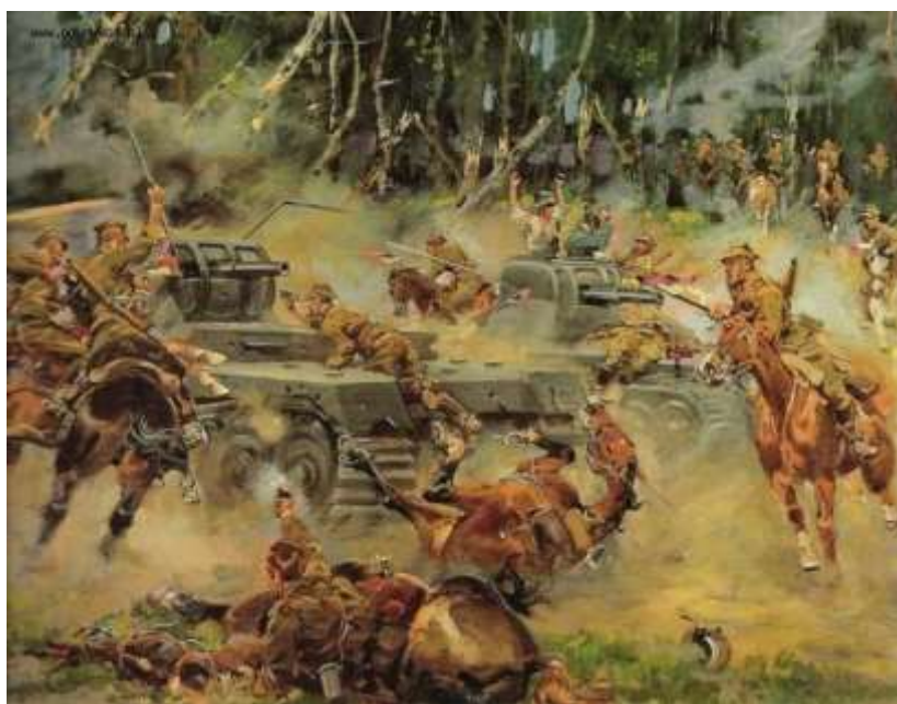
«Битва под Кутно в 1939 г.». К. Ежи

Германская армия существенно превосходила польскую и по численности, и по техническому оснащению: по самолётам — примерно в пять раз, по танкам — в 3,5 раза. Огромное техническое преимущество позволило обеспечить блицкриг — молниеносный разгром противника.